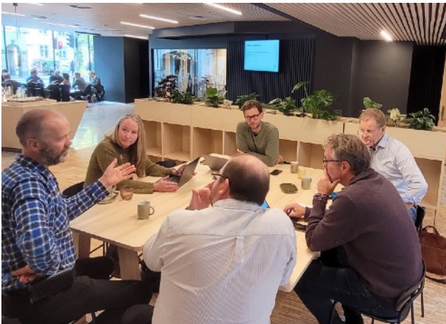
SFI Smart Ocean sitt møte på Nygårdsgaten 5