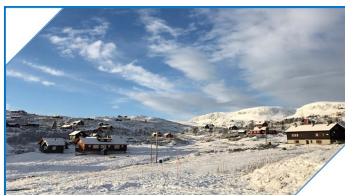
Velkommen til Ustaoset