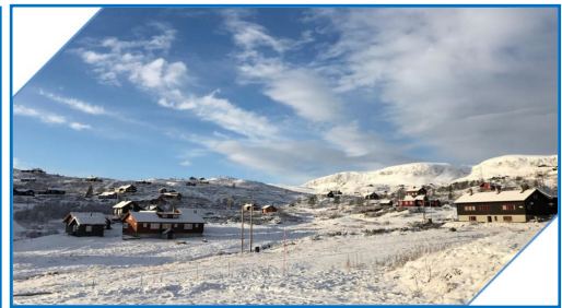
Velkommen til Ustaoset