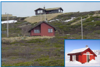
U-heimen med Butten innfeldt

Søknadsfristen er 15. februar, trekningen foretas 19. februar 2018.