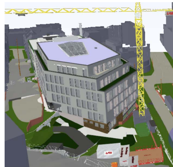
Prosjekt Nygårdsgaten 91-93