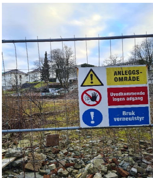
Uvedkommende skal ikke ta seg inn på byggeplassen