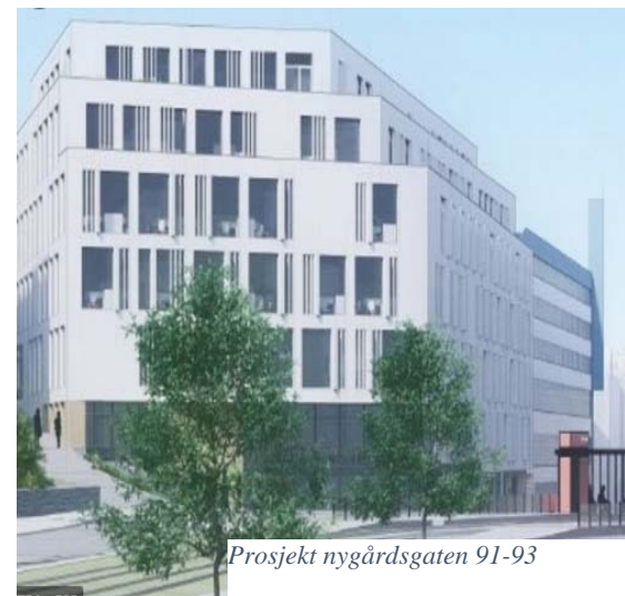
Prosjekt nygårdsgaten 91-93