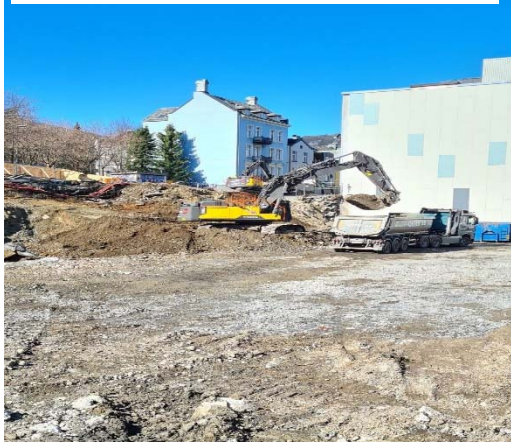
Utgraving av tomten er godt i gang