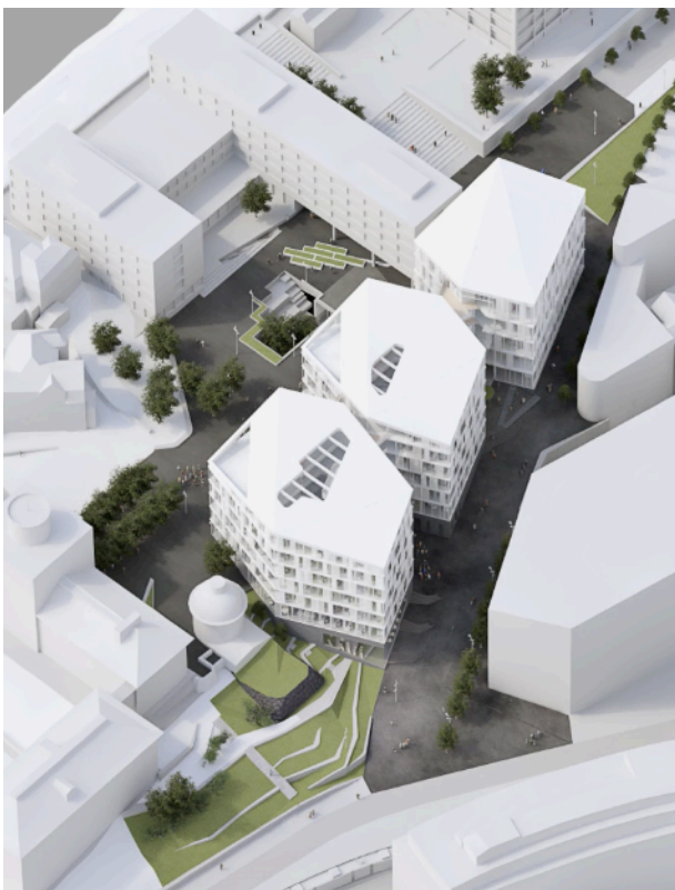
Arkitekttegning av prosjekterte endringer i IFT-bygningen og området

Denne uken var det oppstart for temagruppene i «Nygårdshøyden Sør» (NGHS) som er et campus-utviklingsprosjekt for å skape moderne og hensiktsmessige arealer på den sørlige delen av Nygårdshøyden. Vi er sentrale aktører i dette prosjektet siden vårt bygg skal totalrehabiliteres, og IFT er representert på bred front i 5 temagrupper som skal holde oversikten og gi innspill i prosessen: Sentral brukergruppe, læringsarealgruppe, eksperimentell forskningsaktivitet, arbeidsplass og fellesareal og samhandling. NGHS blir også et spennende tema som ganske sikkert dukker opp på instituttseminaret på Solstrand 4. og 5.oktober. Neste uke sender vi ut påmeldingsskjema for seminaret. I mellomtiden kan man gjerne lese mer på dekanbloggen .