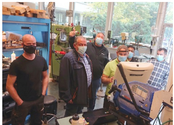
Opplæring i bruk av IFTs nye fleraksefres på verkstedet

På tross av forlengede koronatiltak fra Bergen kommune, og dermed også UiBs tiltak , har verksteds-personellet endelig fått mulighet til fullverdig opplæring på instituttets nye fleraksefres. Som vi ser var det i går sterkt fokus på å oppnå ny kompetanse, og vi kan glede oss til nye muligheter for avanserte mekaniske løsninger for våre forskningsprosjekter.