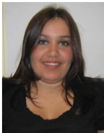
Denita Music Office trainee