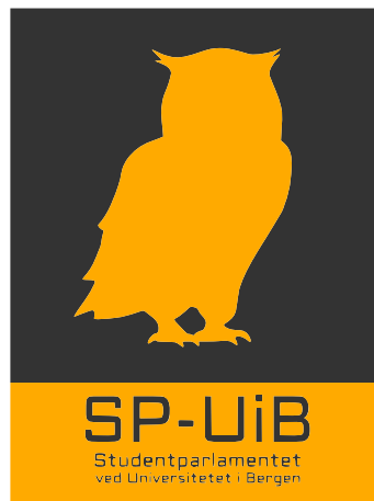
Logo for Realistutvalget og Studentparlamentet.