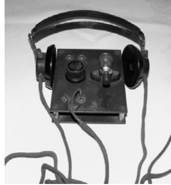
Familieidyll med mørke undertoner fra krigstidens Bergen, : lytting til illegal radio kunne i verste fall medføre dødsstraff for dem som deltok. Nræbilde av en av de vanligst radiomodellene man lyttet til, et såkalt "Sweetheart"-apparat. (Kilder: Billedsamlingen UB Bergen/ Privat samling ).

Opplagstall og utgivelseshyppighet varierte, fra flere tusen eksemplar flere ganger i uken over en årrekke, til utgivelser som besto av noen få ark (gjennomslag) med tilfeldig utgivelse. 5 Undergrunnspressen var av varierende teknisk utforming og kvalitet. Det eksisterte håndskrevne, maskinskrevne og trykte publikasjoner side om side. Her ville man formidle nyheter og meddelelser av mange slag utenom tysk kontroll. 6 BBC's nyheter om krigen i utlandet og politiske paroler kan være eksempler på denne type nyheter. Hovedmotivet var en holdningskamp, man ville skape en holdning, en samlet norsk front mot tyskerne og deres medløpere i Nasjonal Samling. 7