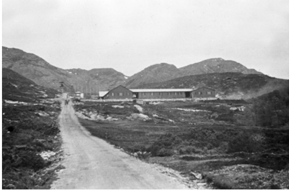
Espeland leir i første del av 1940-årene. I 1942 tok tyskerne leiren i bruk til internering. Etter krigen ble den benyttet som fangeleir for krigens tapere, bl.a. ble norske landsvikere internert her.