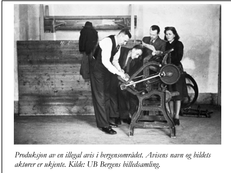
Produksjon av en illegal avis i bergensområdet. Avisens navn og bildets aktører er ukjente.

I dag gir de illegale avisene et enkelt, litt fattigslig inntrykk. De er stort sett uten bilder og illustrasjoner.