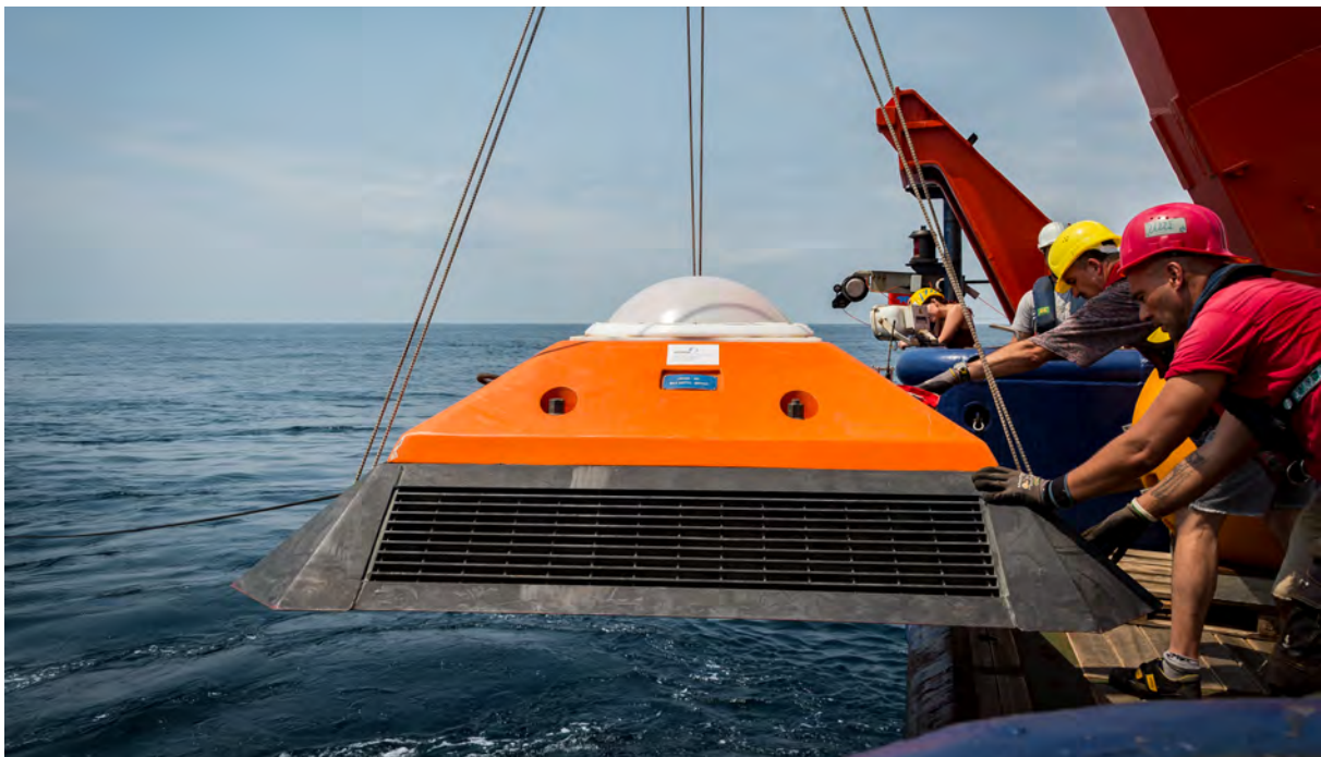
Abb. 2: Auslegung des Bodenschildes mit einem akustischen Strömungsmesser. Die Form des Schildes soll es vor Beschädigung durch Bodenfischerei schützen. Zur Sicherheit wurde eine Bodenleine mitausgelegt, die später auch eine Aufnahme des Schildes bei etwaiger Beschädigung des Auslösers ermöglichen soll.